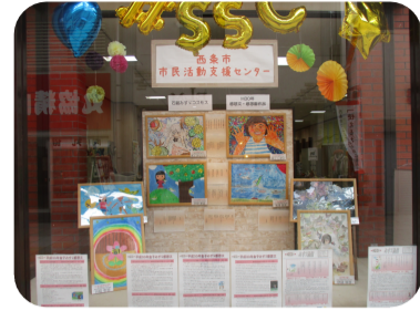
ショーウィンドウ展示

市民活動に関する情報を、登録団体に限らず広く収集し、ホームページ・Facebook・広報紙で発信しました。また、施設内の情報掲示板や屋外のパンフレットラックを活用し、情報を受け取りやすい環境を整備。紺屋町商店街に面したショーウィンドウでは登録団体さんの活動を展示。活動の様子を紹介したり作品発表などに役立てていただきました。