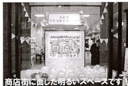
商店街に面した明るいスペースです！