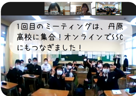
1回目のミーティングは、丹原 高校に集合!オンラインでSSC にもつながりました!

第1回目(10/20)のミーティングでは、 自己紹介や係決め、今後の活動日程を決め ていきました。それぞれが目的意識を持っ て参加してくれており、ミーティングも大 人が驚くほどスムーズに進みました!今後 の活動については、SSCのHPやFacebook等 を使って、高校生が発信していく予定です。