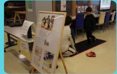
Woman Bodymake Project