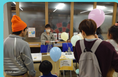
がんサロン「ほっこりの会」